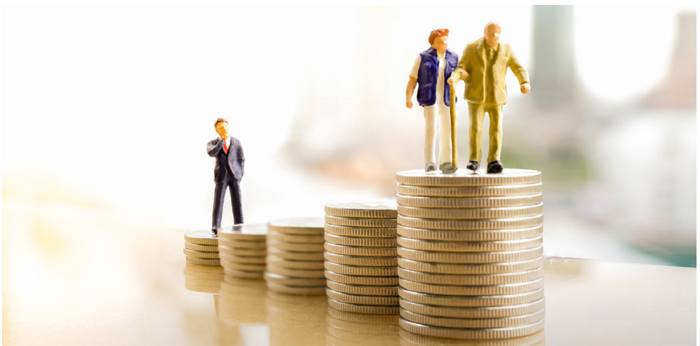
Coeficientes reductores para la jubilación anticipada involuntaria