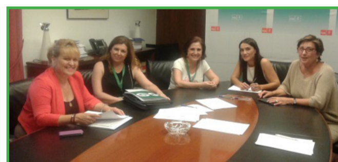
Reunión Grupo Parlamentario Socialista, 29 de julio de 2015

USO ya vaticinó lo que podría ocurrir con la firma del chapucero acuerdo del 23 de diciembre de 2014. Los firmantes de semejante "acuerdo" (FSIE y UGT), aceptaron que la cantidad correspondiente a 2015, la pagara la Consejería a lo largo de tres años (suponían que 2015, 2016 y 2017). Ahora, la realidad es que estamos en el mes de octubre y aún no han pagado ni un solo euro y lo único que hemos constatado es que los compañeros de pública recuperaron en junio su parte adicional de la paga y en diciembre, también la recuperarán. Por tanto, del 100% de Equiparación conseguida en 2011, se ha retrocedido a un 96%.