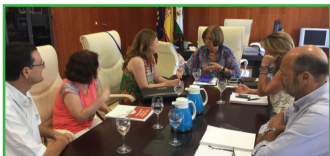
FEUSO Andalucía se reúne con la nueva Consejera de Educación. 21.07.2015