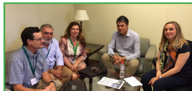
Reunión Grupo Parlamentario Popular, 2 de julio de 2015