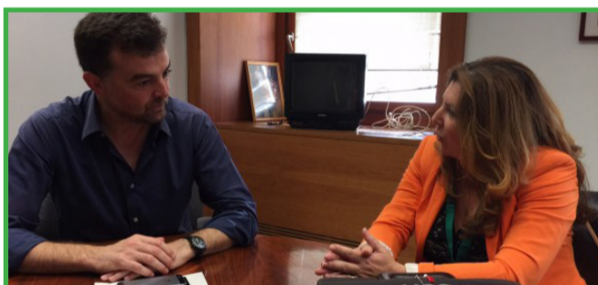
Reunión Grupo Parlamentario Izquierda Unida, 1 de julio de 2015