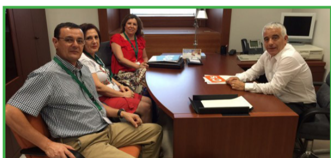
Reunión Grupo Parlamentario Ciudadanos, 8 de julio de 2015